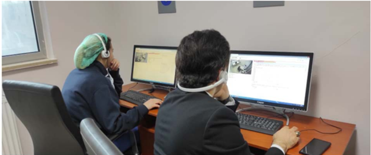
Resim 7.1.1.3. Fakültemiz OSCE sınav salonları.