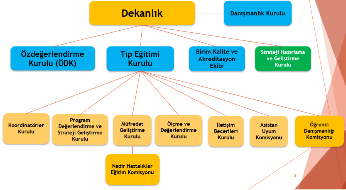
Şekil 9.1.2.1. Fakültemiz eğitimden sorumlu kurul ve komisyonları.