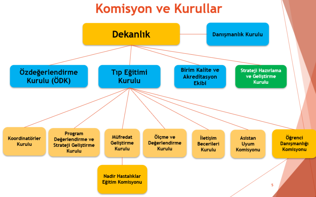
Şekil 8.1.1.1. Fakültemiz eğitimden sorumlu kurul ve komisyonları.

Fakültemiz dekan ve iki dekan yardımcısı, fakülte kurulu, fakülte yönetim kurulu ve 3 Bölüm Başkanlığı ve bağlı anabilim dalı başkanlıklarından oluşan bir akademik yönetim yapısına sahiptir. İdari ve akademik faaliyetlerle ilgili büro işleri fakülte sekreteri tarafından koordine edilmektedir. Dekanlık çalışmalarına destek olmak üzere Tıp Eğitimi Kurulu, Koordinatörler Kurulu, Ölçme ve Değerlendirme Kurulu, Müfredat Geliştirme Kurulu, Program Değerlendirme ve Strateji Geliştirme Kurulu, İletişim Becerileri Kurulu, Birim Kalite ve Akreditasyon Kurulu ve Asistan Uyum Komisyonu aktif olarak çalışan kurullardır. Öz Değerlendirme Kurulu tüm bu kurulların işleyişini, mezuniyet öncesi ve mezuniyet sonrası tıp eğitimi müfredatının işleyişini bağımsız bir yapıyla denetleyerek öneri ve görüşlerini Dekanlığa iletmektedir. Ayrıca Danışmanlık Kurulu oluşturulmuş olup özellikle dış paydaşlarımız ile katkı öneri ve tavsiyeleri alınması planlanmaktadır ( Ek TS.8.1.1/3 Danışmanlık kurulu üyeleri ). Yine yeni oluşturulan Öğrenci Danışmanlığı Komisyonunda 2024-2025 eğitim öğretim yılı itibari ile faaliyete geçmesi planlanmaktadır. Fakültemiz eğitim programının yapısına uygun olarak oluşturulan kurul/komisyonların yönergeleri mevzuata uygun olarak tanımlanmıştır ( https://tip.gantep.edu.tr/pages.php?url=mevzuat-yonetmelik-253 ). Gaziantep Üniversitesi Tıp Fakültesi'nde eğitimden sorumlu kurul/komisyonlar: