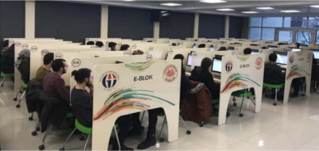
Resim 7.1.1.5. Fakültemiz Ölçme ve Değerlendirme Salonu.