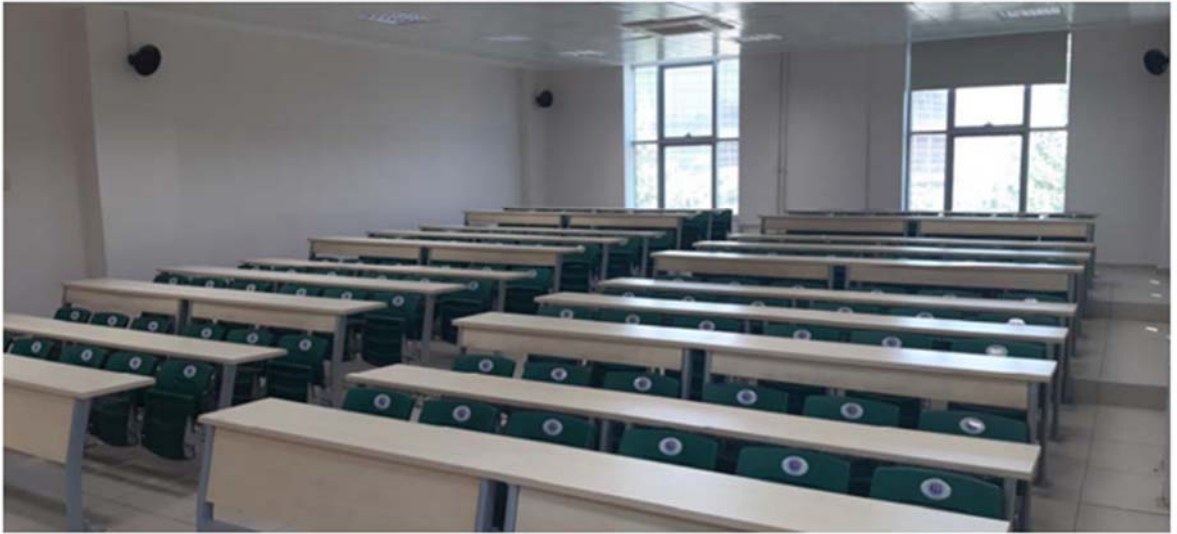
Resim 7.1.1.2. Fakültemiz derslik ve amfileri.