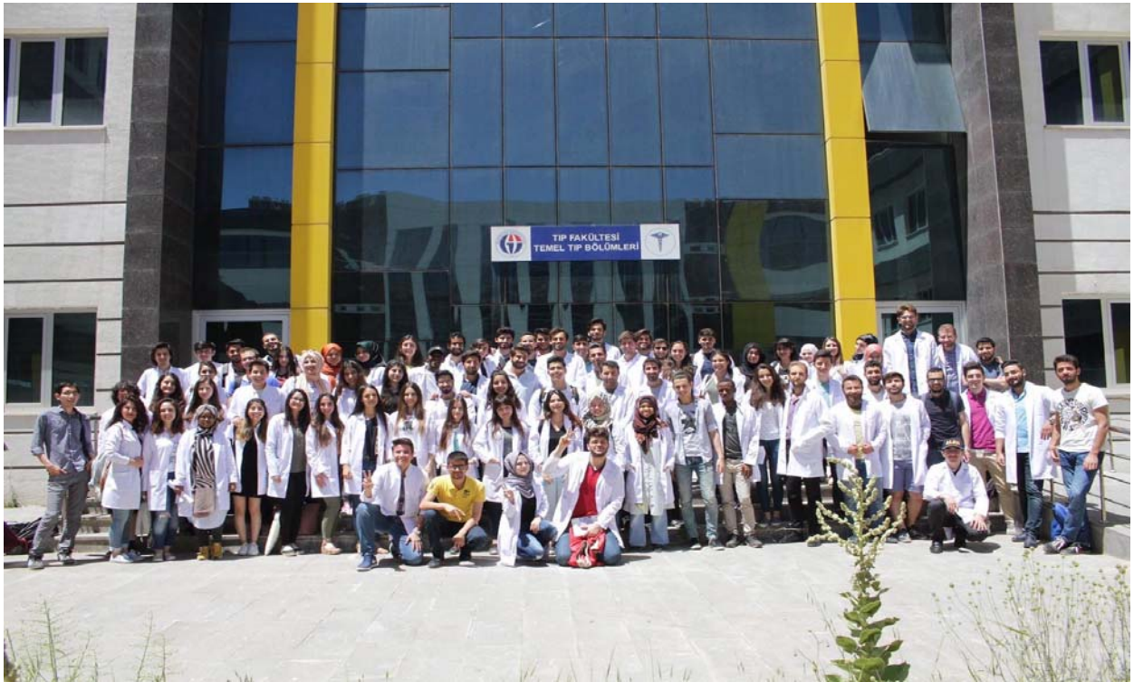
Resim 7.1.1.1. Fakültemiz Temel Tıp Bölümleri binası.

Ayrıca fakültemiz bünyesinde bir adet Temel Beceri Laboratuvarının inşaat alt yapısı tamamlanmış olup eğitim öğretim dönemlerinde kullanılmaya başlanmıştır. Bu alt yapılarda kullanmak amacıyla simülasyon sertifikasyon eğitimleri almış 2 sağlık personeli kadrolu olarak Dekanlık bünyesinde göreve başlamıştır.