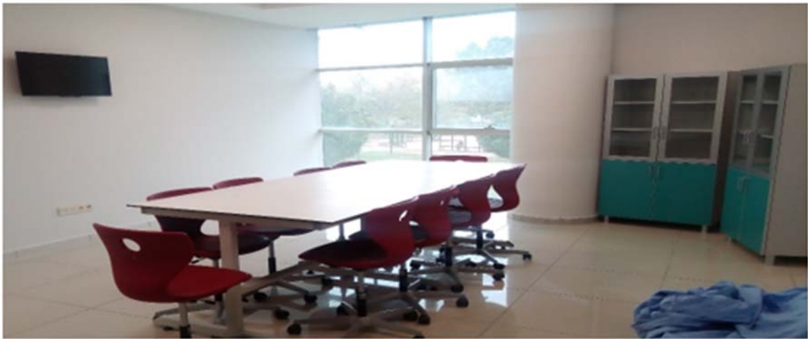
Resim 7.1.1.6. Fakültemiz Temel Mesleki Beceri Laboratuvarları.