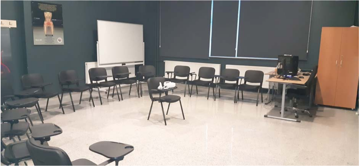
Resim 7.1.1.8. Fakültemiz GAÜNVERSE İBN-İ SİNA AR&VR Laboratuvarı.