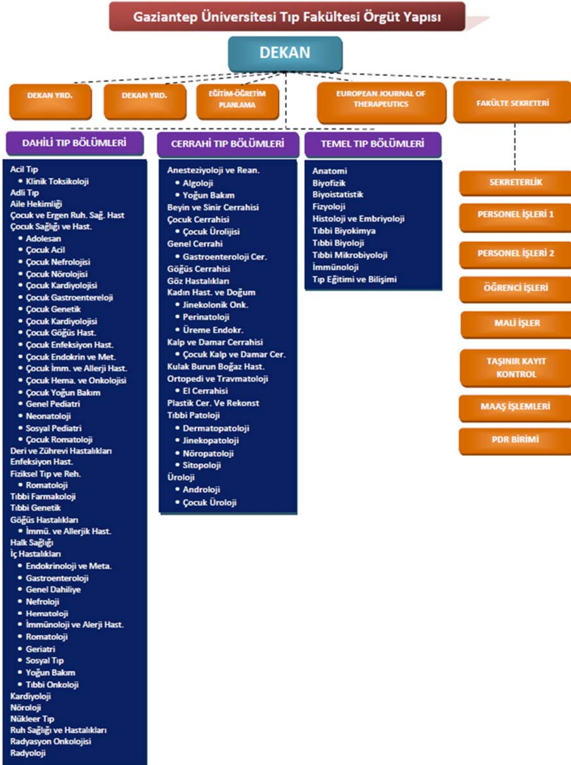
Şekil 8.1.1.2. Fakültemiz örgüt yapısı.