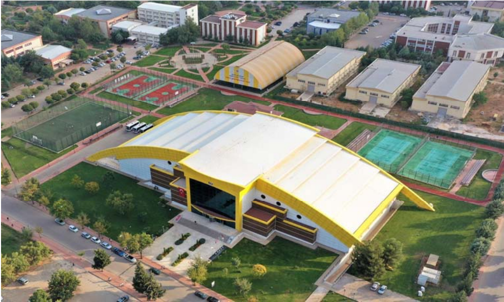
Resim 7.1.1.8. Üniversitemiz GAÜNSPORIUM merkezi.

Fakültemiz derslik binasının hemen yanında bulunan kafeterya alanı sosyal alanlar olarak kullanılabilir. Hastanemizde 3 adet kantin/kafeterya bulunmaktadır. Fakültemiz Dönem VI intörn öğrencilerimiz hastanedeki personel yemekhanelerinden ücretsiz yararlanmaktadır. Fakültemize ait masa tenisi masası mevcut olup öğrencileri ve öğretim üyelerimizin kullanımına sunulmaktadır. Kampüs içinde Fakültemize yakın konumda bulunan GAÜNSPORIUM kompleksi ile öğrencilerimizin kullanabileceği kapalı spor salonları, tenis kortları, yüzme havuzu, futbol/atletizm sahaları, tırmanma duvarı, bowling salonu ve langırt gibi sosyal etkinlik alanları bulunmaktadır ( http://sporium.gantep.edu.tr/ ).