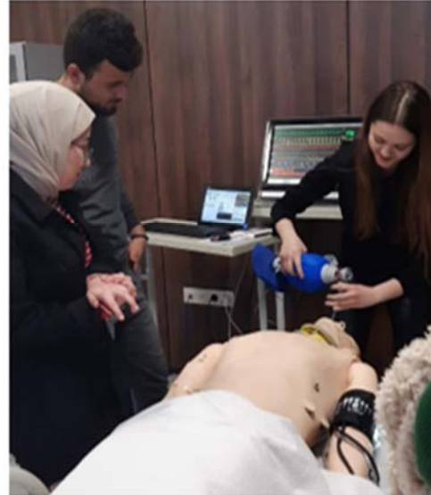
Resim 7.1.1.4. Fakültemiz İleri Düzey Simülasyon Merkezi.